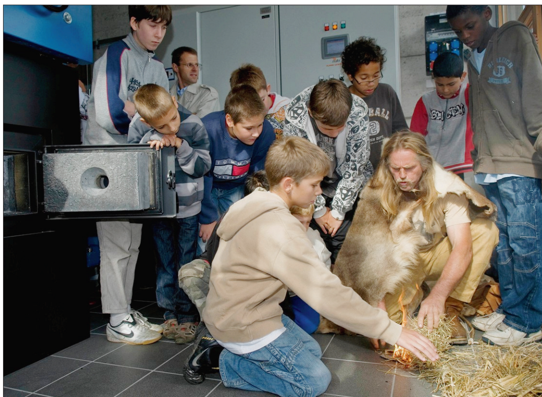
MISE À FEU Les élèves d'une classe du collège des Esserts ont procédé à l'allumage de la chaudière selon une méthode ancestrale, enseignée par un délégué du Laténium, paré d'une peau de caribou.