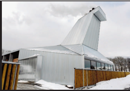
DEHORS ET DEDANS Le bâtiment du CAD par temps hivernal, le foyer vu par le (tout petit) regard ménagé dans la chaudière et l'ingénieure Séverine Scalia, qui pilote l'ensemble du projet.