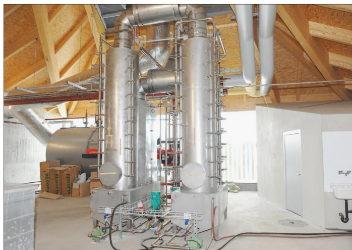
LE CONDENSEUR-LAVEUR Un meilleur rendement et moins de poussières..

De toute façon, relève l'ingénieure Séverine Scalia, qui pilote l'ensemble du projet sur mandat de la commune, «le